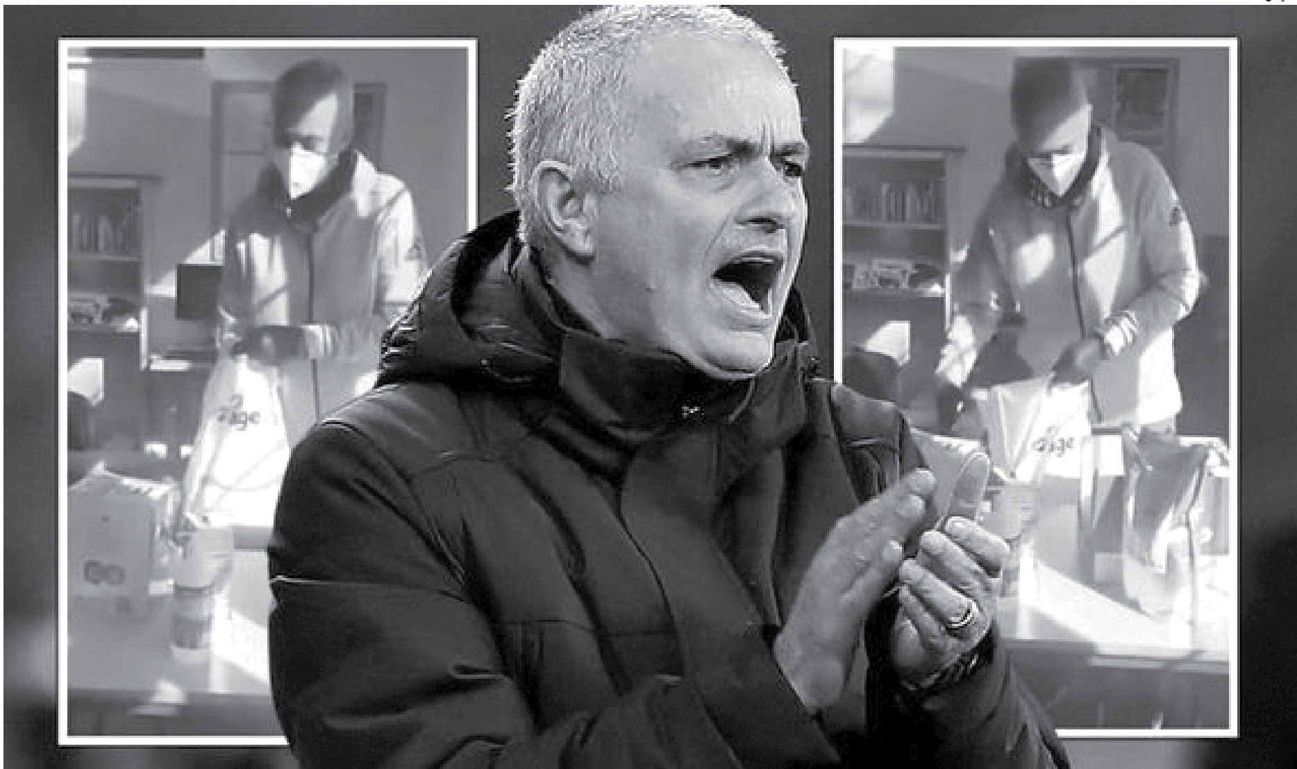
José Mourinho diz que conta com a generosidade de seus colegas e daqueles que querem fazer até uma pequena doação para chutar o coronavírus e vencer essa partida