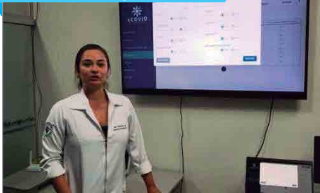
A central funcionará na Unidade 2 do Laboratório de Tecnologias 3D do Nutes, no Hospital de Trauma de CG