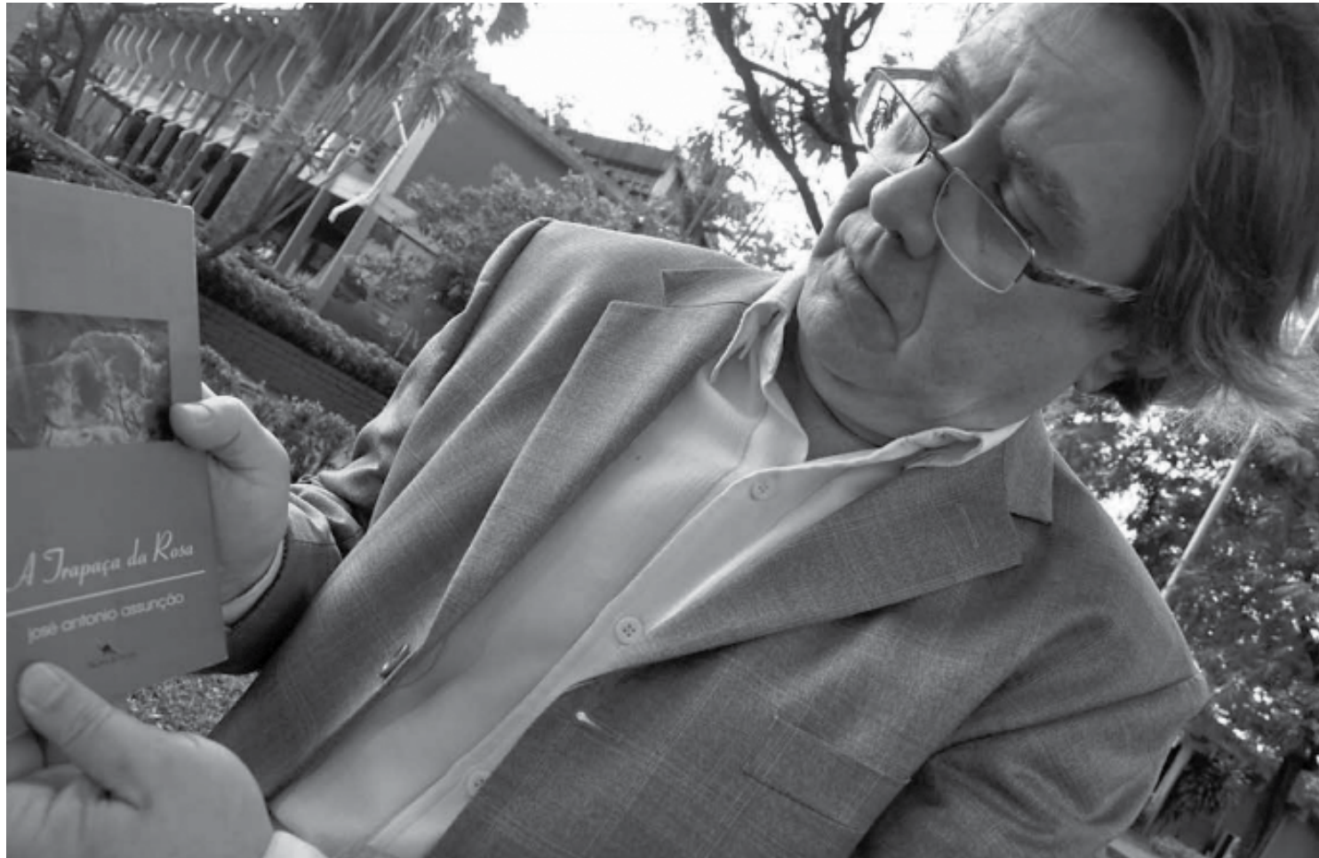
José Antônio Assunção é um dos maiores poetas paraibanos da atualidade, autor de uma poesia sóbria, madura, própria de um escritor íntimo dos seus temas