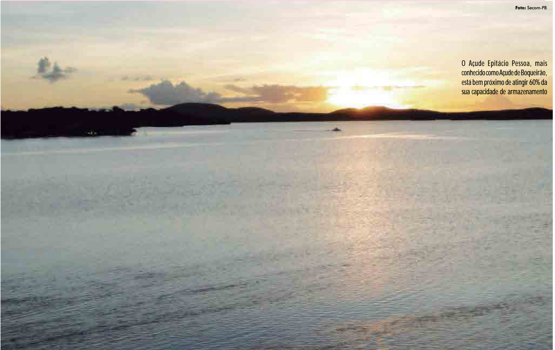
O Açude Epitácio Pessoa, mais conhecido como Açude de Boqueirão, está bem próximo de atingir 60% da sua capacidade de armazenamento