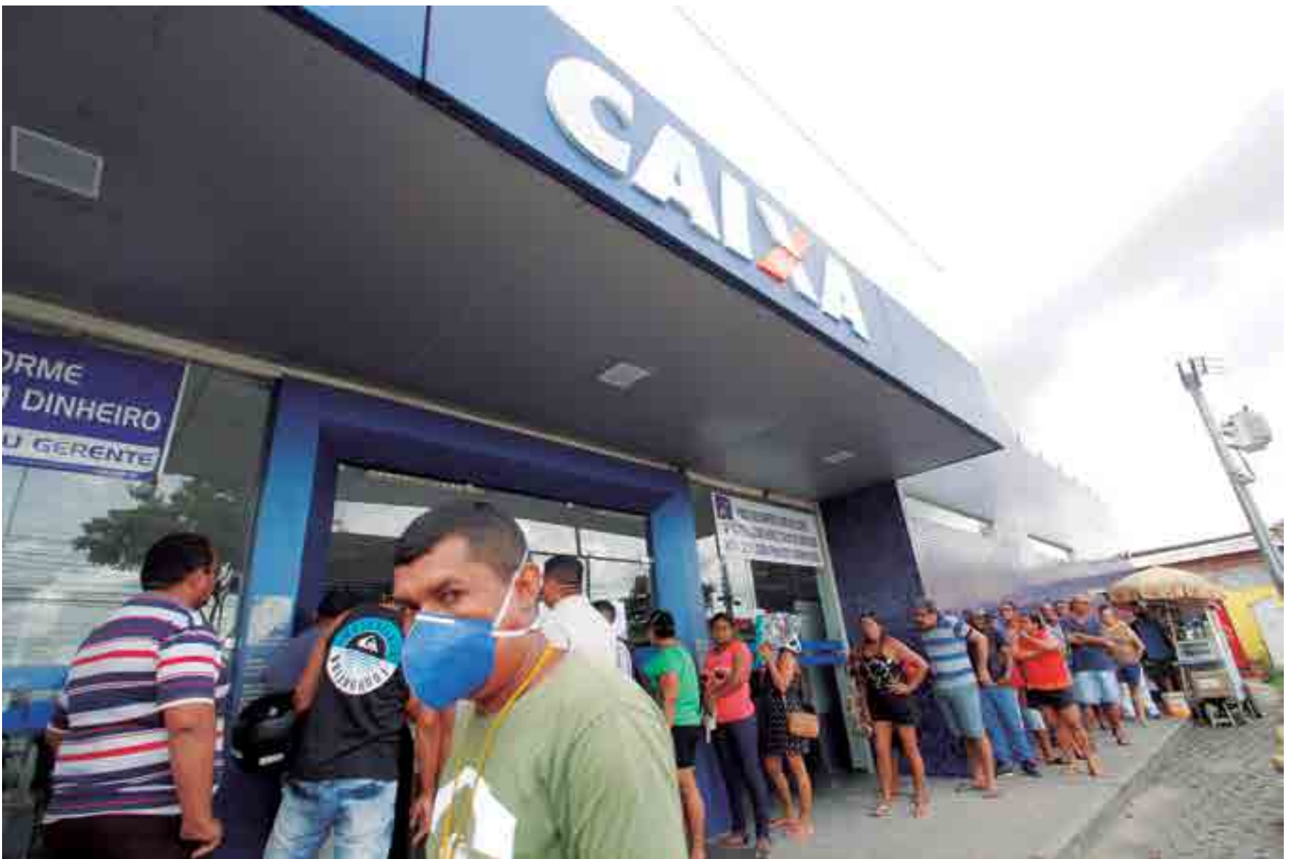
Aposentados e pensionistas beneficiários do INSS foram à Caixa Econômica ontem e lotaram algumas agências; orientação é que distância mínima entre uma pessoa e outra seja um metro e meio

Conforme a SMS-JP, durante a quarentena, é preciso evitar filas e aglomerações de pessoas, em especial os idosos, que fazem parte do grupo de risco. A indicação é que os aposentados e pensionistas utilizem os meios digitais, tais como o aplicativo do banco no qual recebe os benefícios, owhatsapp ou o próprio site da instituição financeira pode auxiliar ti-