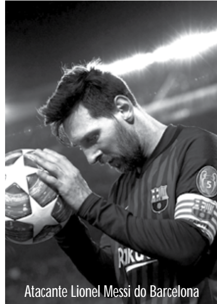
Atacante Lionel Messi do Barcelona

valor de 1 milhão de euros (cerca de R$ 5,5 milhões) para um hospital de Barcelona com o objetivo de ajudar no combate ao avanço do novo coronavírus na cidade catalã. A Espanha vem se tornando um dos países mais atingidos pela pandemia nos últimos dias.