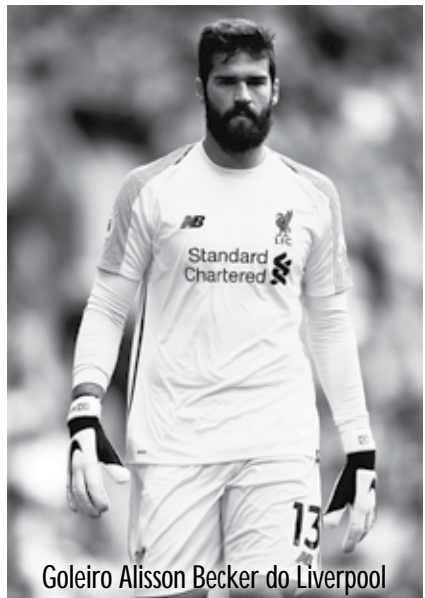
Goleiro Alisson Becker do Liverpool